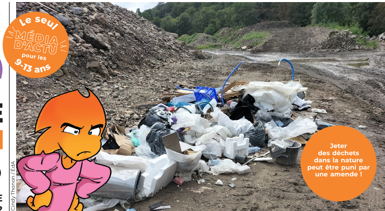
Cindy Thonon / EGA

Des tonnes de déchets sont jetées dans la nature en Wallonie. L'impact sur la nature et les citoyens est important. Tu as sans doute déjà vu des canettes sur le bord de la route en te promenant. Et peut-être as-tu déjà participé à des campagnes de ramassage avec l'école ou avec ta famille et tes amis. Que fais-tu si tu vois quelqu'un lancer un déchet ? Que penses-tu des sanctions pour ceux qui laissent leurs ordures hors des poubelles ? Faudrait-il plus de poubelles le long des routes et des parcs ? Quelles sont pour toi les meilleures solutions pour éviter les déchets dans la nature ?