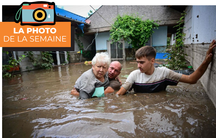
LA PHOTO DE LA SEMAINE

Un seul mégot, qui aura besoin de 10 à 15 ans pour se dégrader, peut polluer 500 litres d'eau !